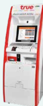
ตู้ทรูมันนี่