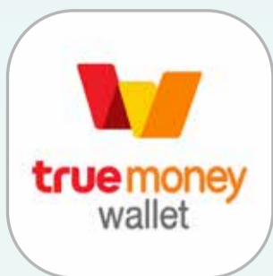
ทรูมันนี่ วอลเล็ต