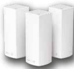
Linksys Velop Mesh

ปกติ 3,990.- พิเศษ จ่ายเพิ่มเพียง 100 บาท/บาท/จุด เมื่อสมัครแพ็คเกจจอร์จ ซูเปอร์ ไฟเบอร์ ที่ร่วมรายการ (ลูกค้าปัจจุบันก็รับสิทธิ์ได้)