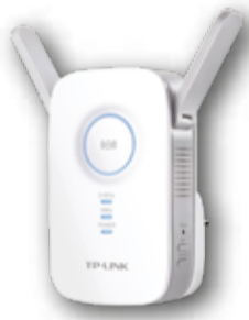
TP-Link RE350 AC1200