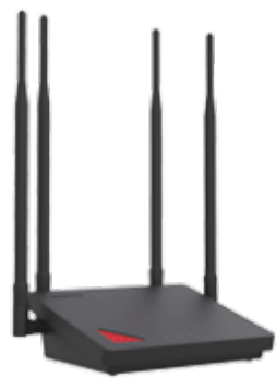
Humax Quantum T3ATV2 AC1200