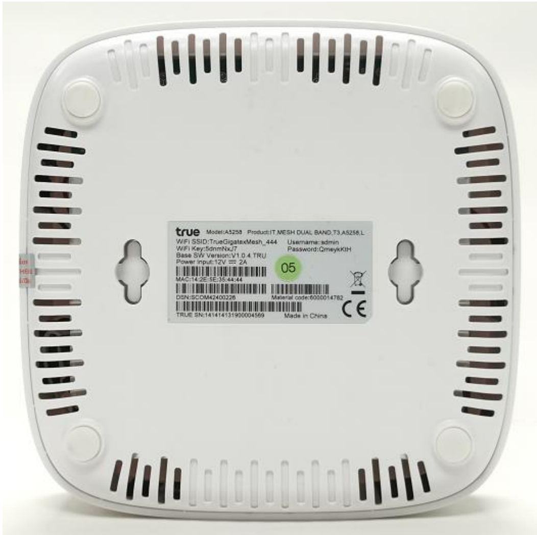
ตัวเครื่องด้านซ้าย