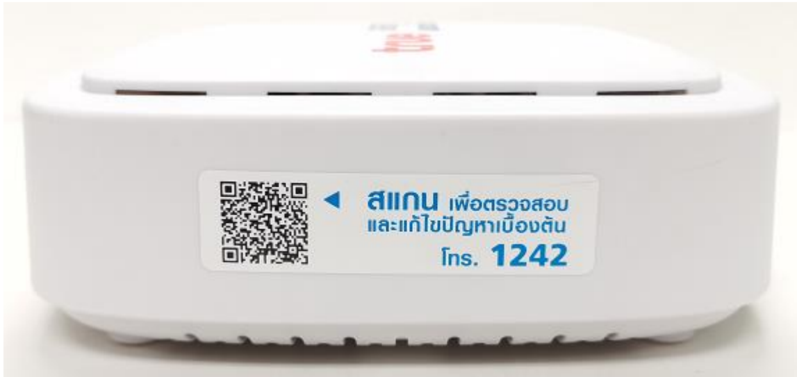
สถานะไฟของ T3 MESH A5258