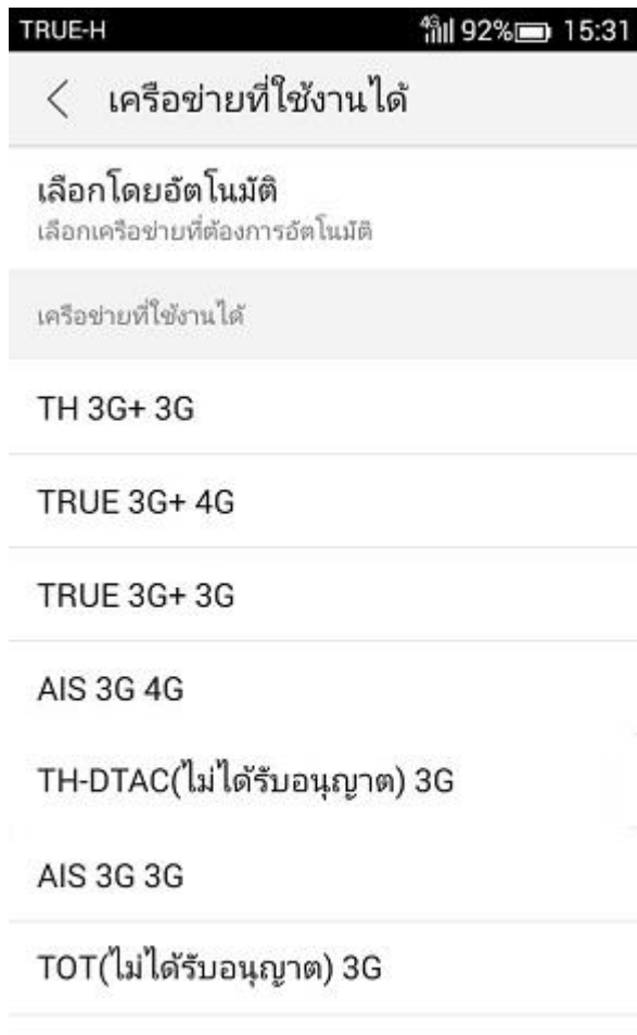
ค้นหาเครือข่าย

5. เมื่อเครื่องหยุดการค้นหา ให้เลือกชื่อเครือข่ายอื่นๆ ที่ไม่ใช่ของทรู เช่น AIS, dtac เป็นต้น