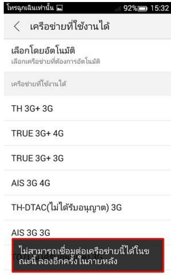
ค้นหาเครือข่าย

6. เมื่อเลือกแล้ว จะพบ Error แสดงการลงทะเบียนเครือข่ายไม่สำเร็จ